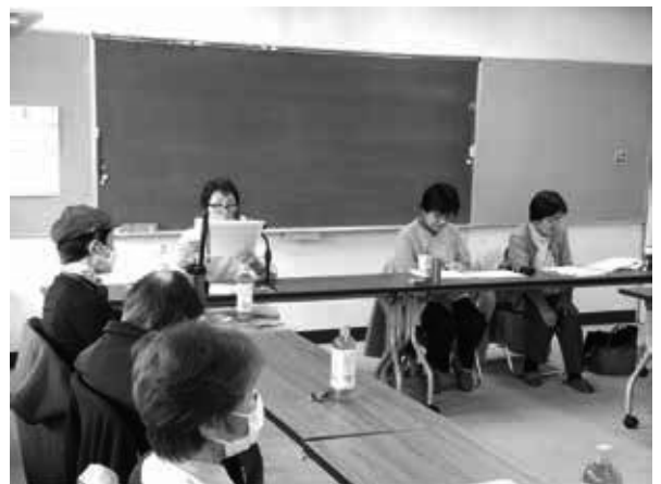
3月定例会音訳さん