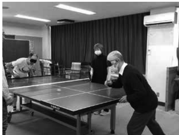
STT体験(榎林会員と中沢会員)