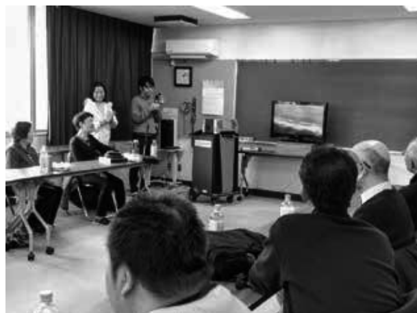
見学に来たスガさんの先読み体験