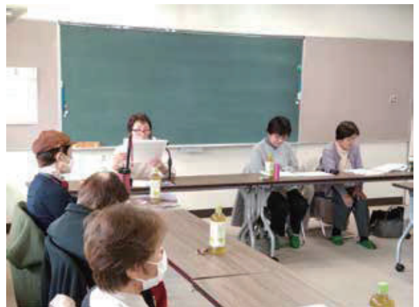
3月定例会音訳さん