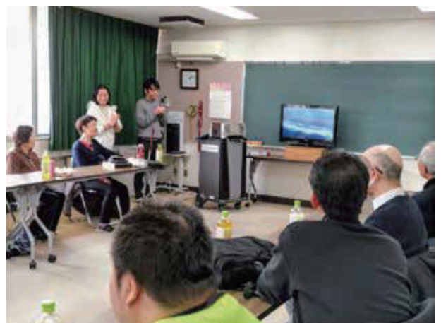
見学に来たスガさんの先読み体験